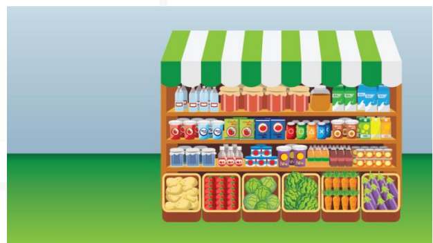
Esempi di situazioni presentate nel gioco